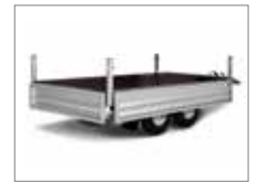
Alle 4 Bordwände sind serienmäßig abklappbar

Die Serie 3000 ist ein Hochlader erhältlich als Einachser oder als Tandem-Anhänger. Die Räder sind unterhalb der Ladefläche angebracht. Dadurch erhältst Du eine breitere Ladefläche und Du verlierst keine Ladebreite aufgrund der Räderposition. Ab Modell 3251SUB750 kannst Du alle 4 Bordwände serienmäßig abklappen. Du findest weiteres Zubehör auf unserer Webseite. Bilder dienen nur der Veranschaulichung, Abbildung ähnlich.