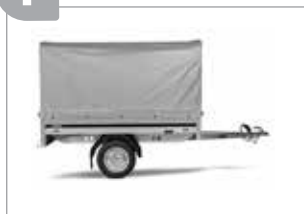
Hochplane mit Gestell