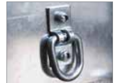
Inneres Verzurrsystem bis 400 daN